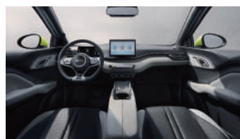
Crna i siva